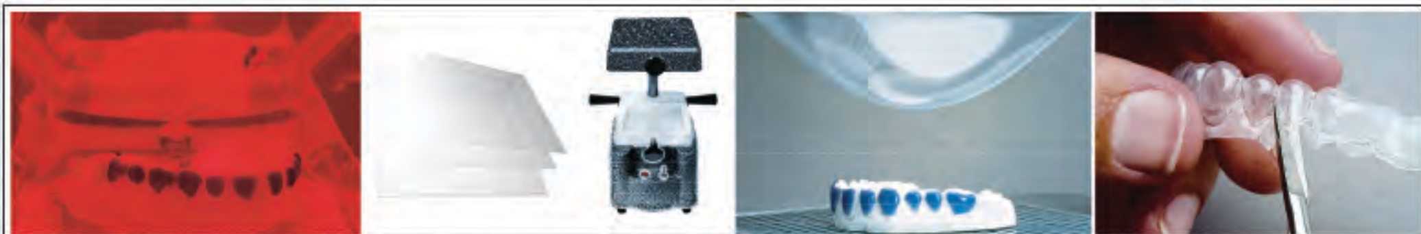
Фотополимеризация LC Block Out Resin